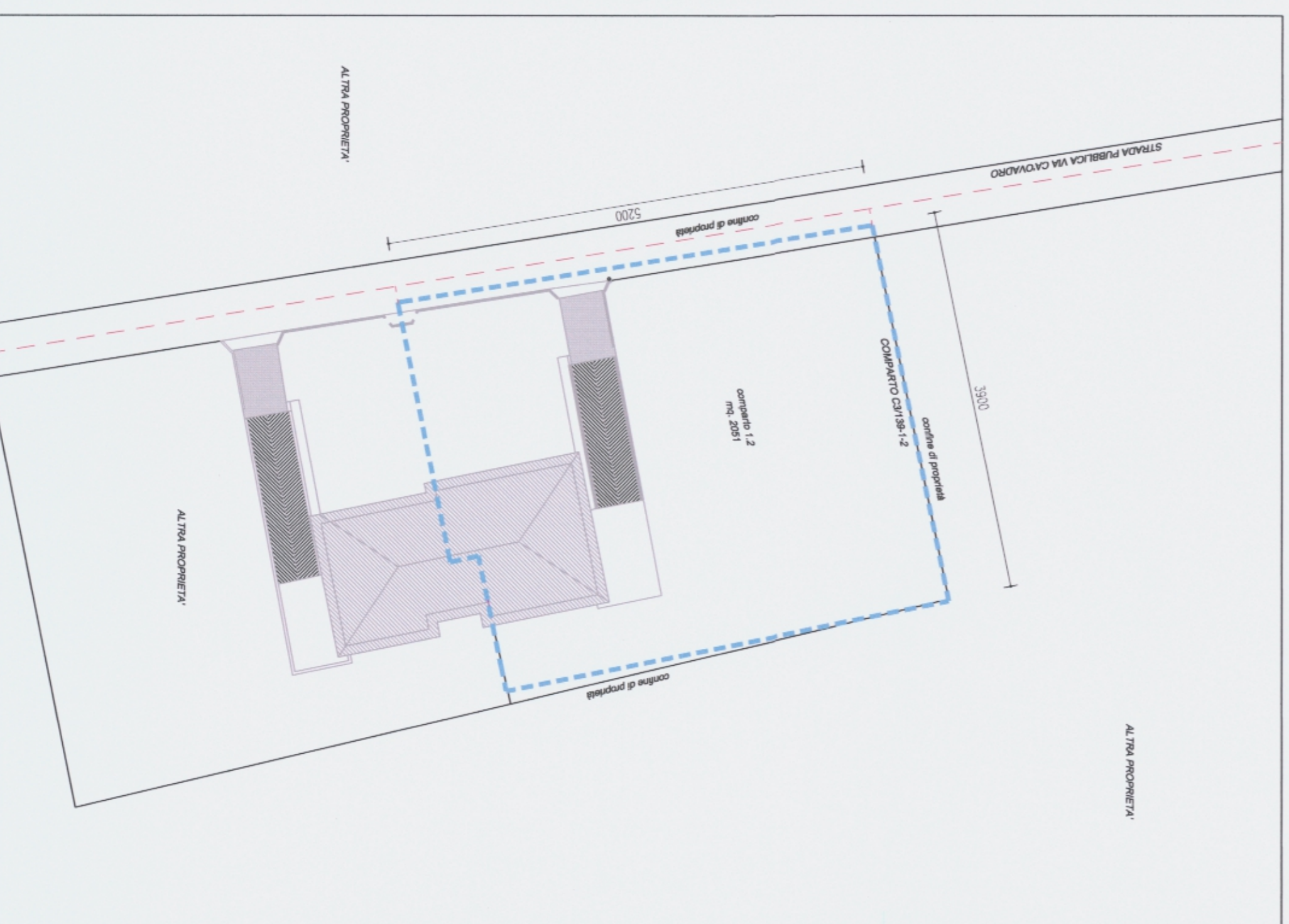
COMPARTO ATTUALE - superficie mc. 2051,00 SCALA 1:500