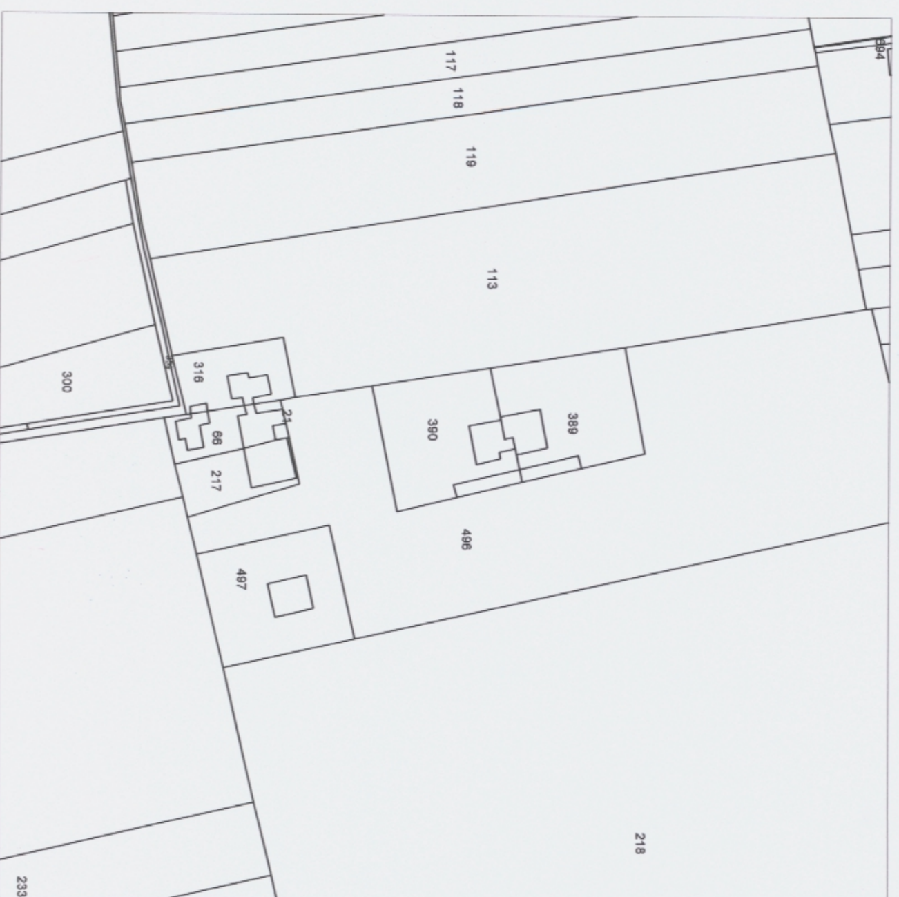
ESTRATTO DI MAPPA CATASTALE COMUNE DI CITADELLA FOGLIO 13 MAPPALE 389 SCALA 1:2000